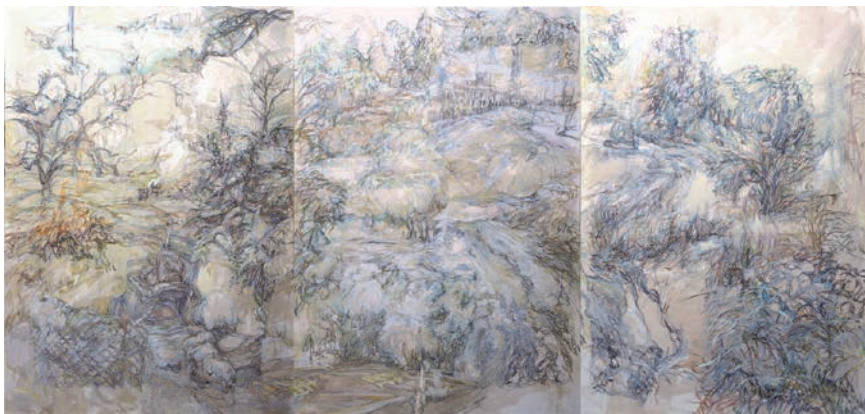
阪本 結「雪の沓掛」(2021年)