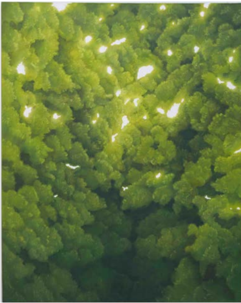
馬見塚 喜康「こもれび」(2019)

2回目となる本展覧会では、2019年度に開催した「第2回公募アートハウスおやべ現代造形展」で受賞した3名の作家の作品を個展形式で紹介いたします。独自の新しい表現を追い求め、美の創造に挑戦する3名の「今」をご覧ください。