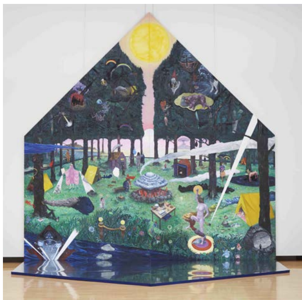
コヤマ イッセー「《絶望から生まれる希望は角笛により召喚される—このままからそのままへ—》」(2019)