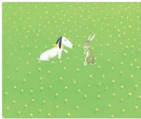
絵本『しあわせってなあに?』より/2002年

葉 祥明【よう しょうめい】(絵本作家・画家・詩人)。1946年熊本市生まれ。1973年創作絵本『ぼくのべんちにしるいとり』でデビュー。1990年、創作絵本『かぜとひょう』でポーロニャ国際児童図書展グラフィック賞受賞。1991年「北鎌倉葉祥明美術館」、2002年「葉祥明阿蘇高原絵本美術館」を開館。絵本『地雷ではなく花をください』詩画集『Life is.....』など著作多数。 http://www.yohshomei.com