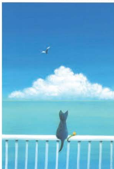
絵本『Open Your Heart』より/2019年