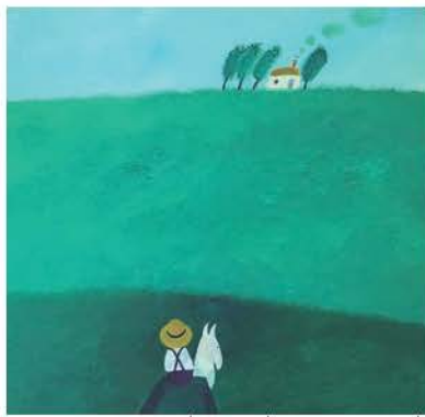
絵本『おばあちゃんだいすき』より/1975年