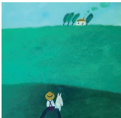
絵本『おばあちゃんだいすき』より/1975年