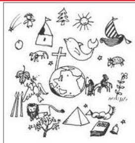
絵本『かみさまへのてがみ』より/1977年

日時：4月4日(土) 14:00~14:30 場所：小矢部市民図書館 おはなしのへや