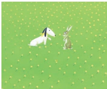
絵本『しあわせってなあに?』より/2002年

葉 祥明【よ しょうめい】(絵本作家・画家・詩人)。1946年熊本市生まれ。1973年創作絵本『ぼくのべんちにしろいとり』でデビュー。1990年、創作絵本『かぜとひょう』でポローニャ国際児童図書展グラフィック賞受賞。1991年「北鎌倉葉祥明美術館」、2002年「葉祥明阿蘇高原絵本美術館」を開館。絵本『地雷ではなく花をください』詩画集『Life is.....』など著作多数。 http://www.yohshomei.com