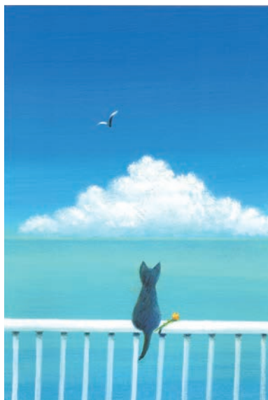
絵本『Open Your Heart』より/2019年