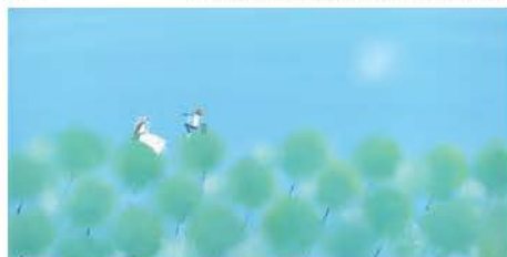
「幸せの時間」 1970年代後半～1980年代前半