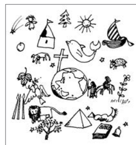
絵本『かみさまへのてがみ』より/1977年