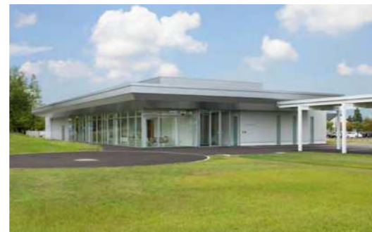
アートハウスとアートガーデン