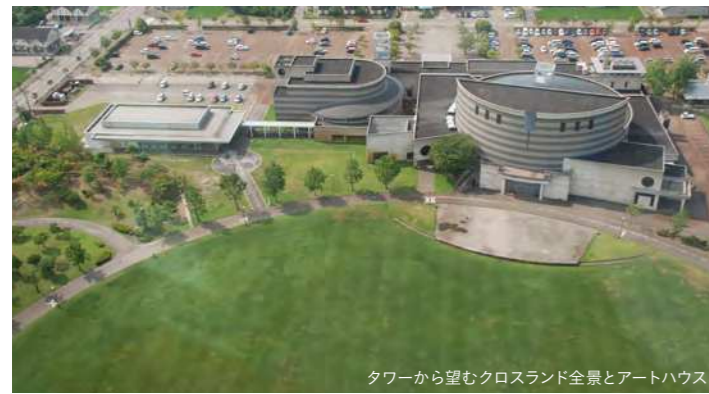
タワーから望むクロスランド全景とアートハウス

2015年9月にオープンした小矢部市の美術館。白を基調としたシンプルな外観、自由に仕切れる展示室、ガラス張りの明るく開放的なオープンギャラリーが特徴です。建物周辺には緑の展示空間(アートガーデン)が広がります。