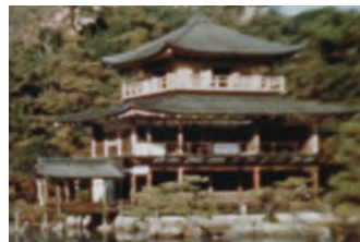
佐藤弘隆《金閣寺 Super Resolution》(部分) 2022年(参考図版)

「アートの実験空間」は、新たな美の創造をめざす作家やグループに、既存の枠組みにとらわれない自由で実験的な作品発表の場を提供する展覧会シリーズです。