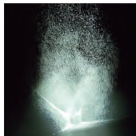
「particles」 2015 年