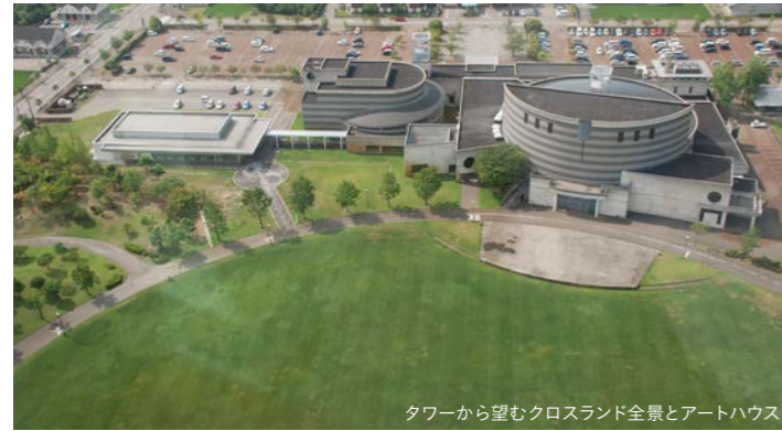
タワーから望むクロスランド全景とアートハウス

2015年9月にオープンした小矢部市の美術館。白を基調としたシンプルなお外観、自由に仕切れる展示室、ガラス張りの明るく開放的なオープンギャラリーが特色です。建物周辺には緑の展示空間(アートガーデン)が広がります。