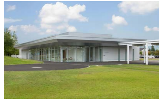
アートハウスとアートガーデン