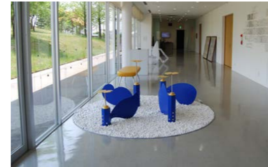
オープンギャラリー